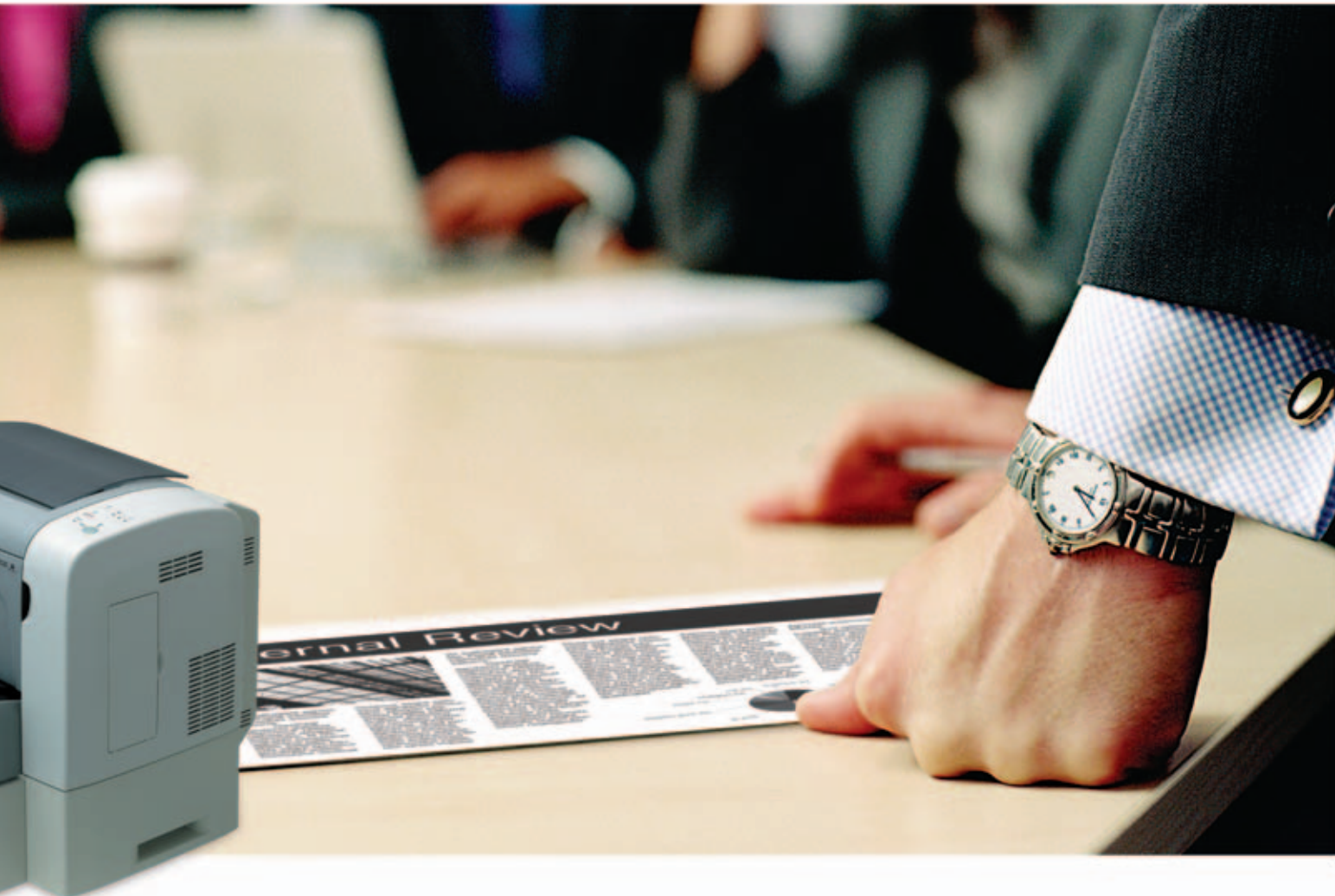
EPSON EPL-6200 met extra lade voor 500 vellen en duplex-eenheid